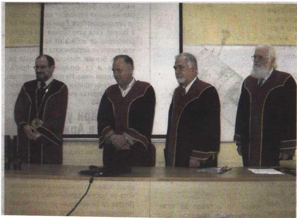
В. Марица, 4 ноември 2011 г.