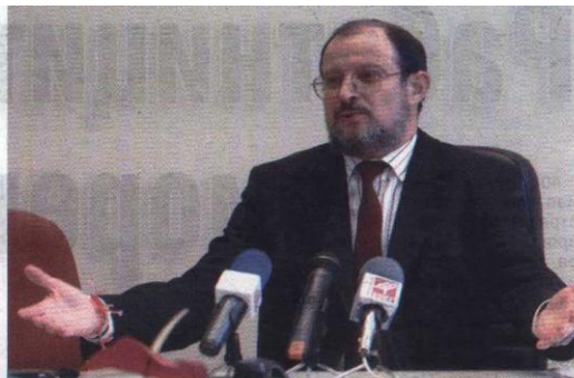
Събитието е посветено на 50-годишнината на университета, затова както международното, така и българското участие са в по-голям мащаб, подчерта ректорът на ПУ доц. д-р Запрян Козлуджов.