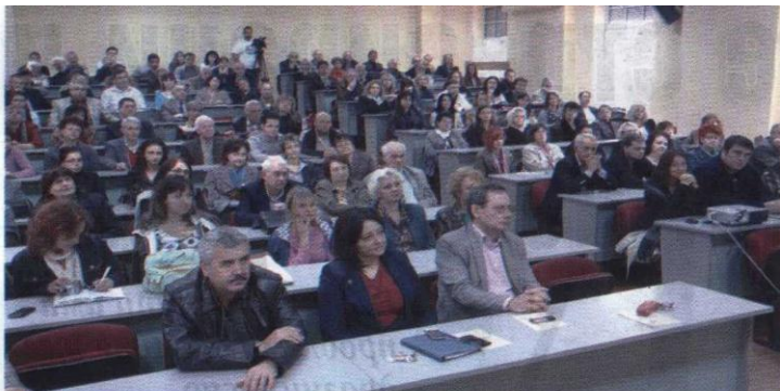
Рещуа учени ще напълнят шеста аудитория за откриването на конференцията „Паисиеви четения“.